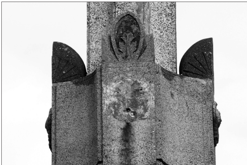
Ilustr. 16. Fragment Pomnika Zwycięstwa z miejscem po zdemontowanej kopii awersu medalu oraz kopia awersu medalu po zdemontowaniu zdeponowana w Muzeum w Stargardzie, 2006 r.