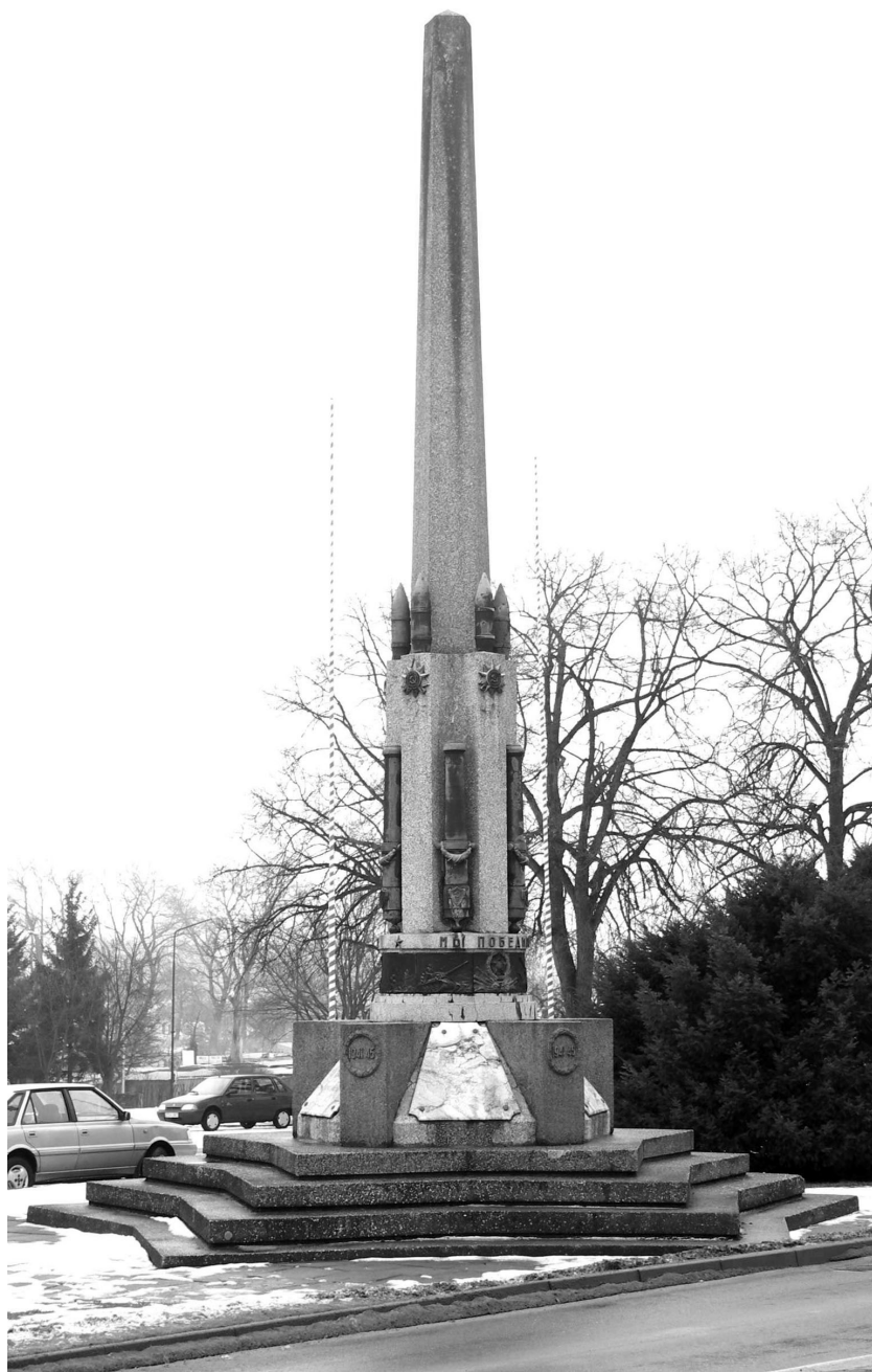
Ilustr. 18. Pomnik przy ul. Wolności w Choszcznie, 2005 r.