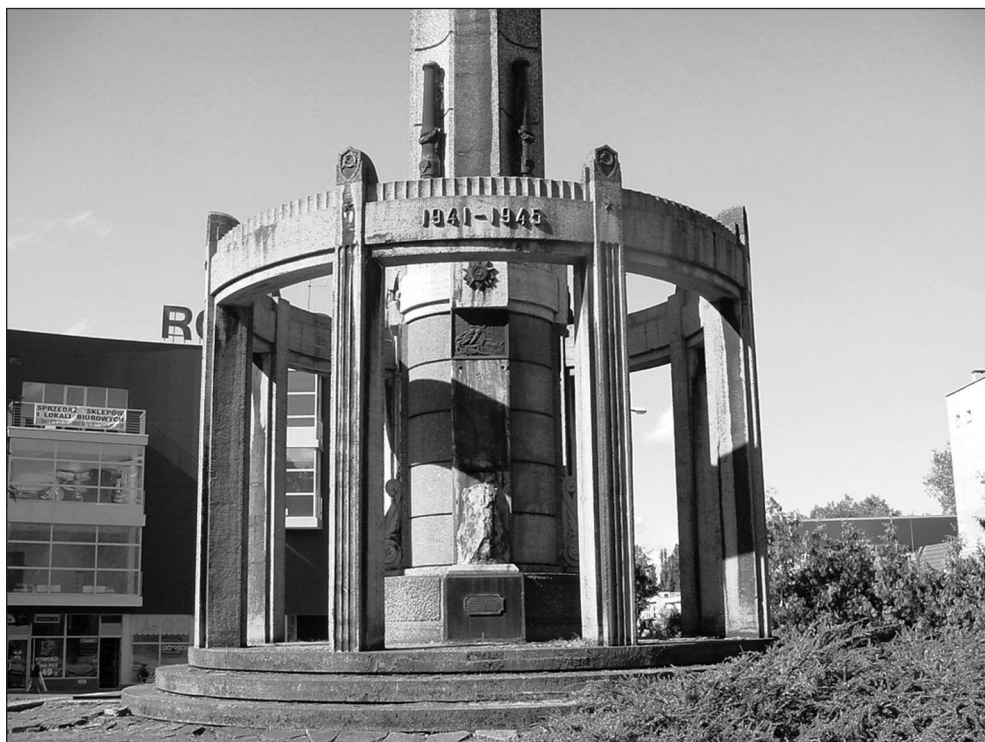
Ilustr. 4. Kolumnada z datami Wojny Ojczyźnianej 1941–1945 (strona wschodnia), 2005 r.