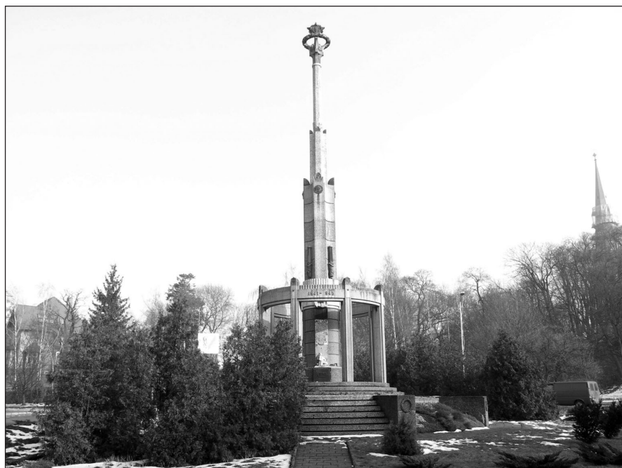
Ilustr. 2. Pomnik Zwycięstwa, widok od ul. kard. S. Wyszyńskiego (strona zachodnia), 2005 r.