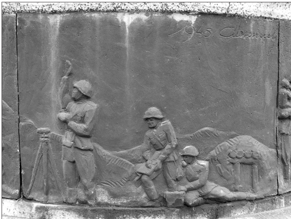
Ilustr. 19. Brązowa tablica na pomniku w Choszcznie (strona wschodnia) sygnowana w prawym górnym rogu przez kapitana Miezencewa, 2005 r.