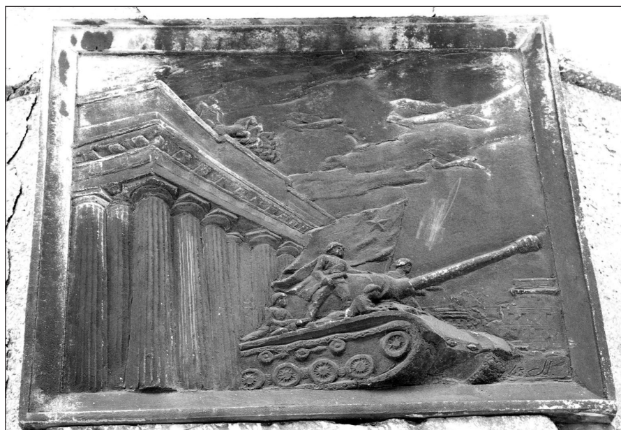
Ilustr. 9. Brązowa tablica z Kolumny Zwycięstwa w Stargardzie (strona południowa), 2005 r.