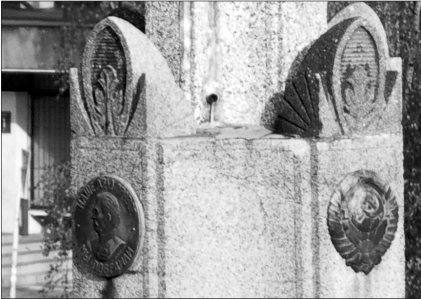
Ilustr. 14. Awers medalu „Za Zwycięstwo nad Niemcami w Wielkiej Wojnie Ojczyźnianej 1941 - 1945” oraz godło ZSRR na Pomniku Zwycięstwa (strona południowo - zachodnia), 2005 r.