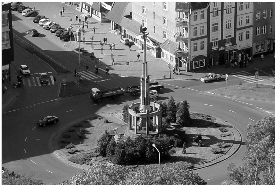
Ilustr. 1. Plac Wolności i Pomnik Zwycięstwa, widok z wieży kościoła św. Jana, 2005 r.