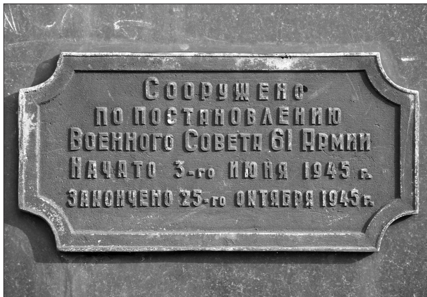
Ilustr. 6. Tablica informacyjna na Pomniku Zwycięstwa (strona wschodnia), 2005 r.