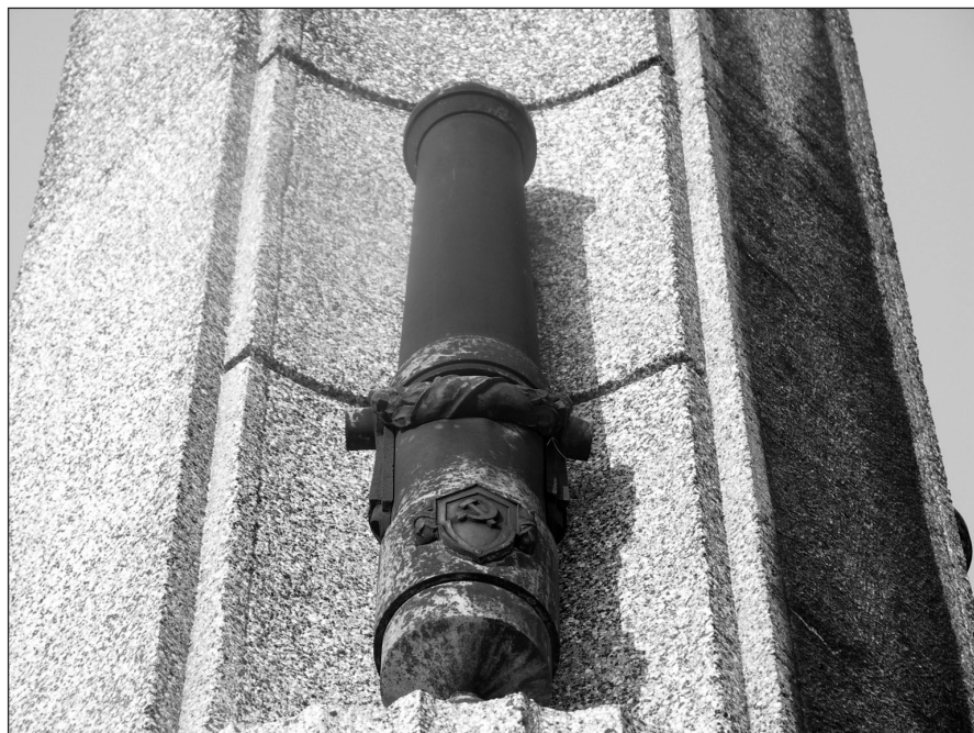
Ilustr. 13. Jedna z czterech brązowych luf armatnich odlanych w Choszcznie umieszczona na Pomniku Zwycięstwa w Stargardzie (strona południowo-zachodnia), 2005 r.