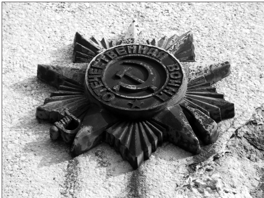
Ilustr. 12. Order „Za Wojnę Ojczyźnianą” na Pomniku Zwycięstwa (strona południowa), 2005 r.