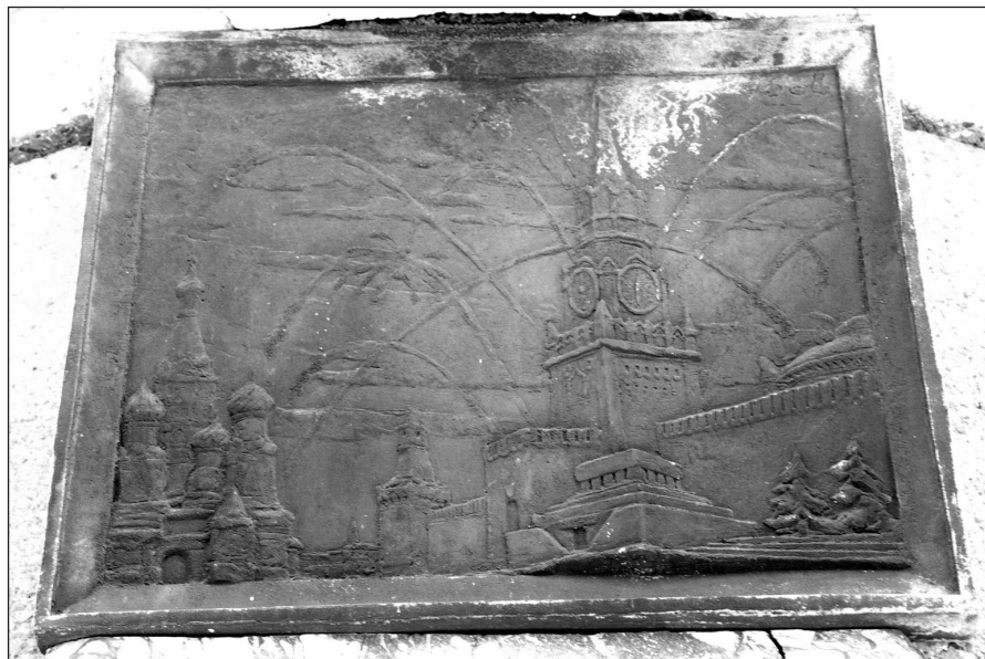
Ilustr. 8. Brązowa tablica z Kolumny Zwycięstwa w Stargardzie (strona zachodnia), 2005 r.