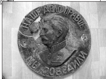
Ilustr. 15. Kopia awersu medalu „Za Zwycięstwo nad Niemcami w Wielkiej Wojnie Ojczyźnianej 1941 - 1945” na Pomniku Zwycięstwa (2005 r.), oryginał awersu medalu oraz kopia awersu medalu po zdemontowaniu i zdeponowaniu w Muzeum w Stargardzie w 2005 r.