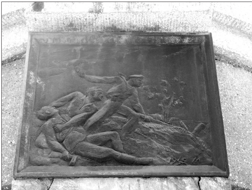
Ilustr. 10. Brązowa tablicat z Kolumny Zwycięstwa w Stargardzie (strona wschodnia), 2005 r.