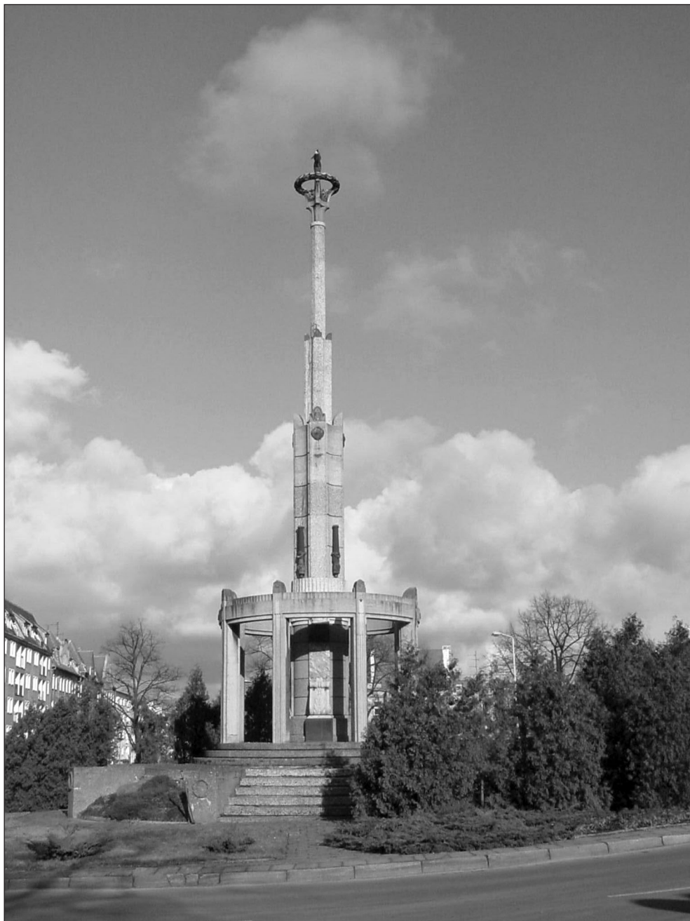
Ilustr. 3. Pomnik Zwycięstwa, widok od strony ul. Świętojańskiej (strona południowa), 2005 r.