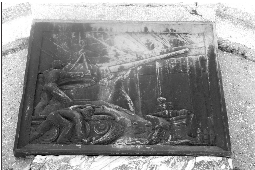
Ilustr. 11. Brązowa tablica z Kolumny Zwycięstwa w Stargardzie (strona północna), 2005 r.