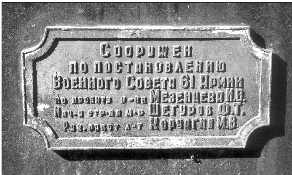
Ilustr. 5. Tablica informacyjna na Pomniku Zwycięstwa (strona zachodnia), 2005 r.