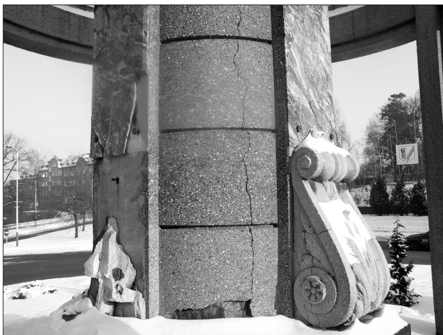
Ilustr. 7. Dwa modyliony na Kolumnie Zwycięstwa - ten po lewej stronie już praktycznie nie istnieje (strona południowo-zachodnia), 2005 r.